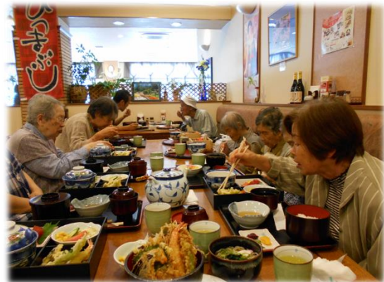
<外食行事 行先：丹波マーケス内 まこと寿司>

利用者活動計画(年間行事計画)に沿って実施する「外出(外食・買い物)」や「季節の行事(花見・運動会等)」、屋外活動として「バーベキューパーティ」、法人行事では「日帰り親睦旅行(今年は舞鶴)」に取り組みました。