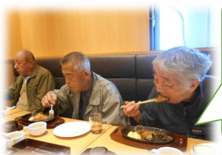
ステーキ宮へ 行きました。