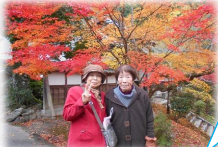
園部町仁江の龍穩寺へ